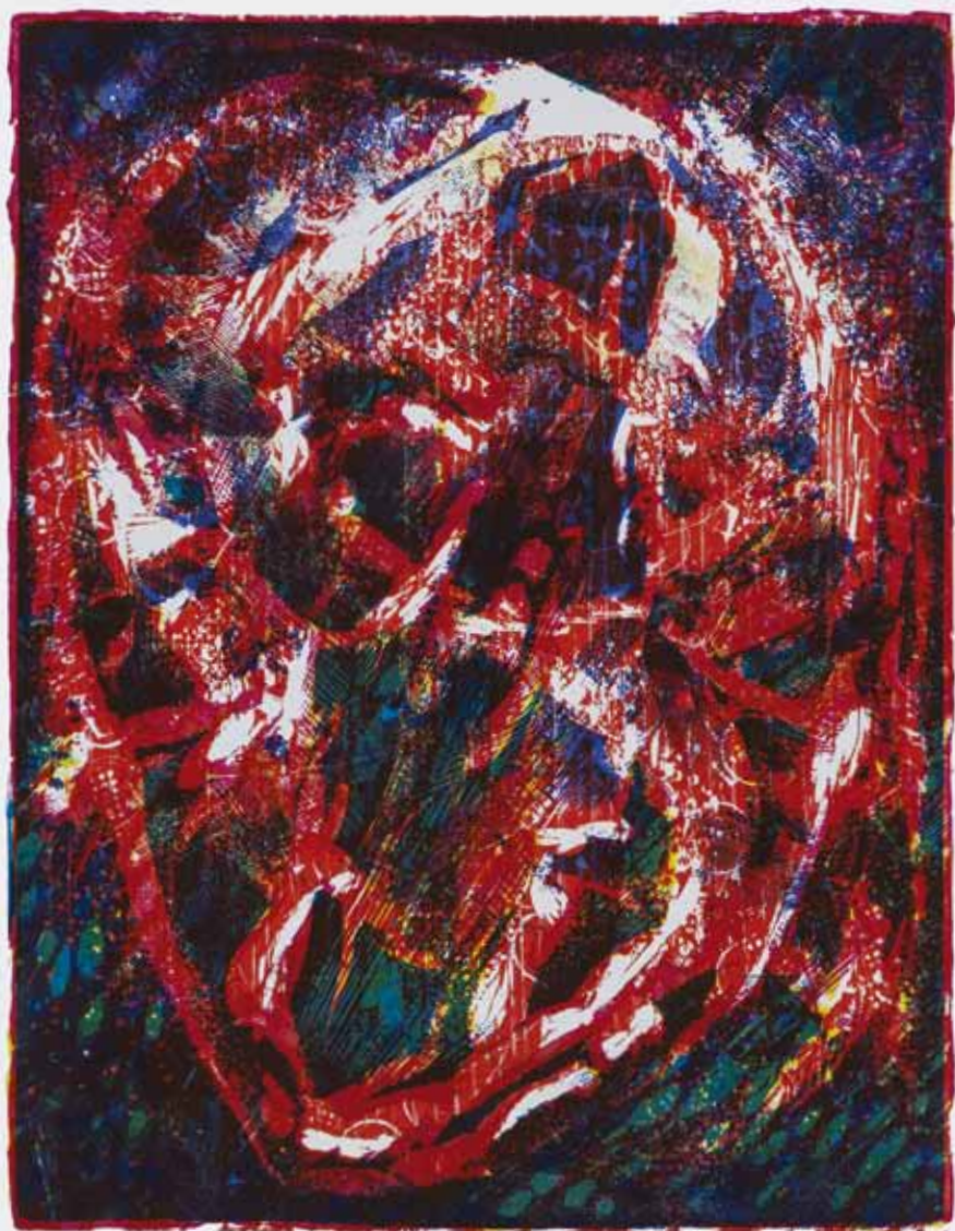
Ubaldo Monico «By / Corpo astrale / Ovulo rosso», 1973, xilografia a colori, 35 x 27 cm