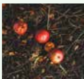
Residui non decomposti del precedente processo di compostaggio